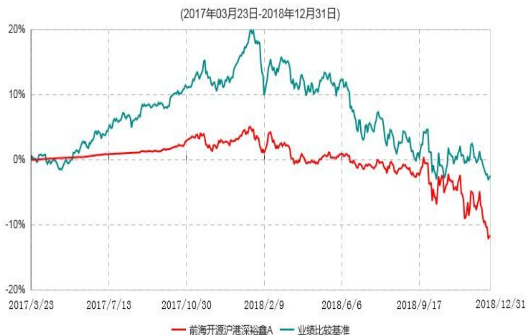
前海开源沪港深裕鑫A累计净值增长率与业绩比较基准收益率历史走势对比图