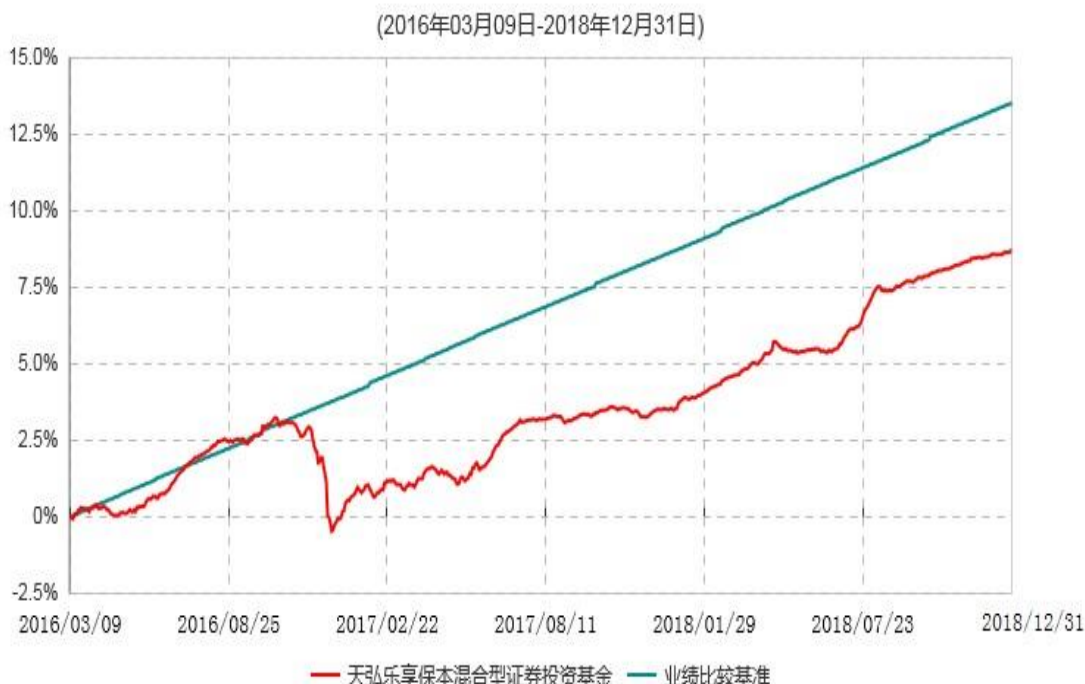
天弘乐享保本混合型证券投资基金累计净值增长率与业绩比较基准收益率历史走势对比图