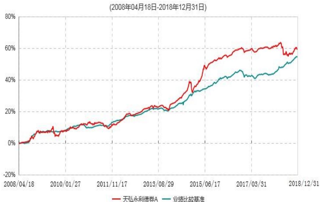
天弘永利债券A累计净值增长率与业绩比较基准收益率历史走势对比图