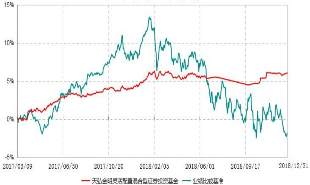
天弘金明灵活配置混合型证券投资基金累计净值增长率与业绩比较基准收益率历史走势对比图 (2017年03月09日-2018年12月31日)