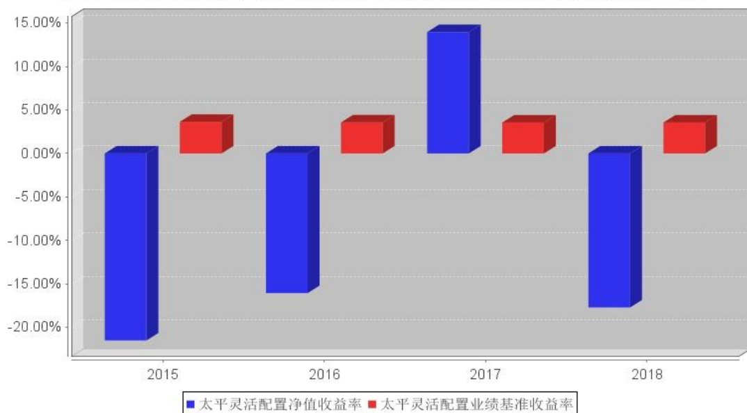
太平灵活配置基金每年净值增长率与同期业绩比较基准收益率的对比图

注:1、本基金基金合同生效日为 2015 年 2 月 10 日,至本报告期末未满 5 年。