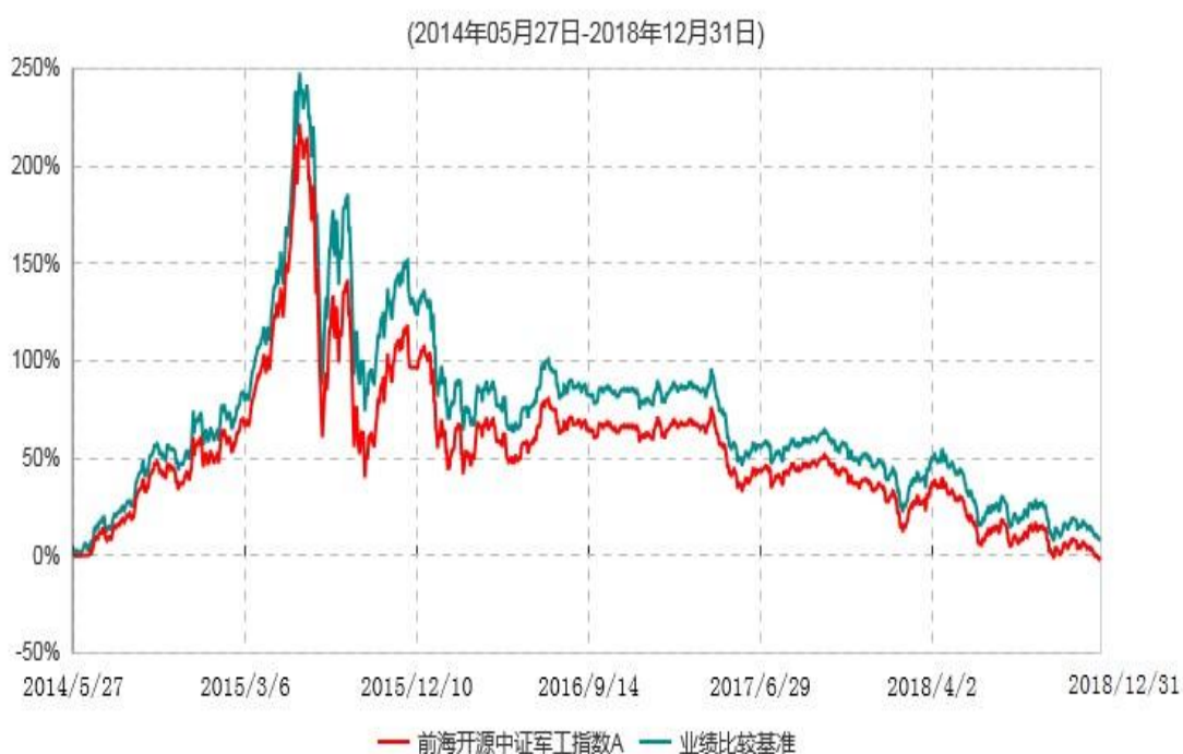
前海开源中证军工指数A累计净值增长率与业绩比较基准收益率历史走势对比图