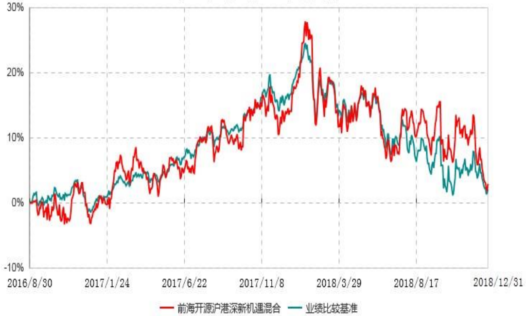
前海开源沪港深新机遇灵活配置混合型证券投资基金累计净值增长率与业绩比较基准收益率历史走势对比图 (2016年08月30日-2018年12月31日)