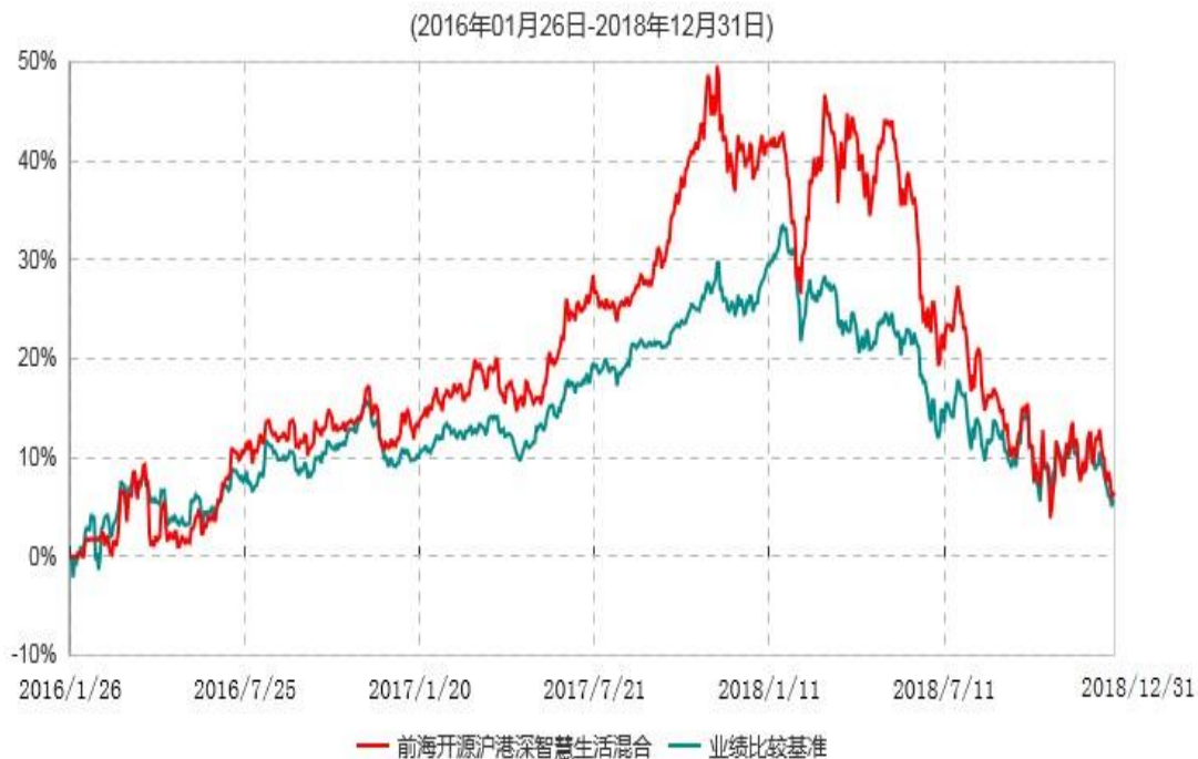
前海开源沪港深智慧生活优选灵活配置混合型证券投资基金累计净值增长率与业绩比较基准收益率历史走势对比图