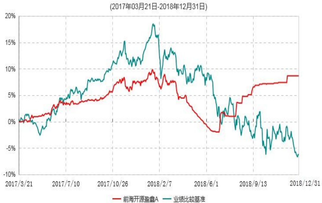
前海开源盈鑫A累计净值增长率与业绩比较基准收益率历史走势对比图