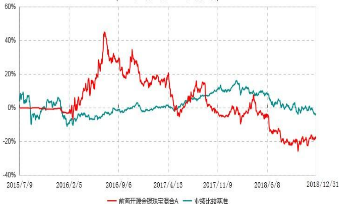
前海开源金银珠宝混合C累计净值增长率与业绩比较基准收益率历史走势对比图