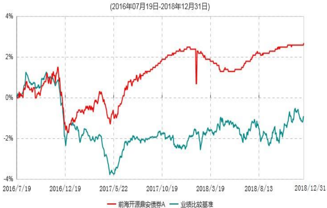
前海开源鼎安债券A累计净值增长率与业绩比较基准收益率历史走势对比图