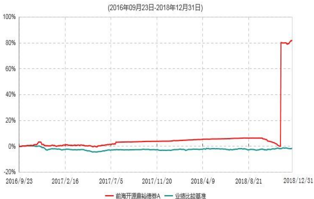
前海开源鼎裕债券A累计净值增长率与业绩比较基准收益率历史走势对比图