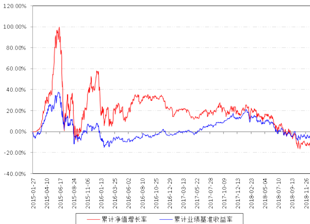
南方产业活力股票累计净值增长率与同期业绩比较基准收益率的历史走势对比图