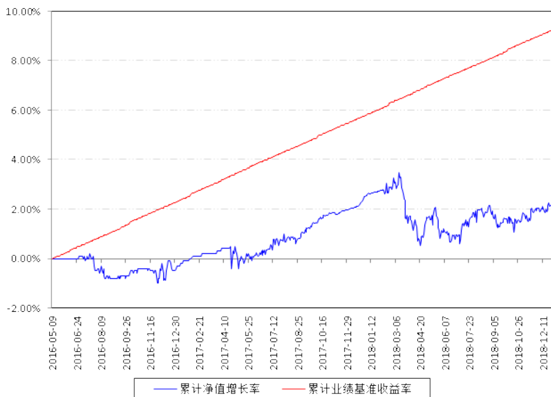
南方卓享绝对收益策略定期开放混合累计净值增长率与同期业绩比较基准收益率的历史走势对比图