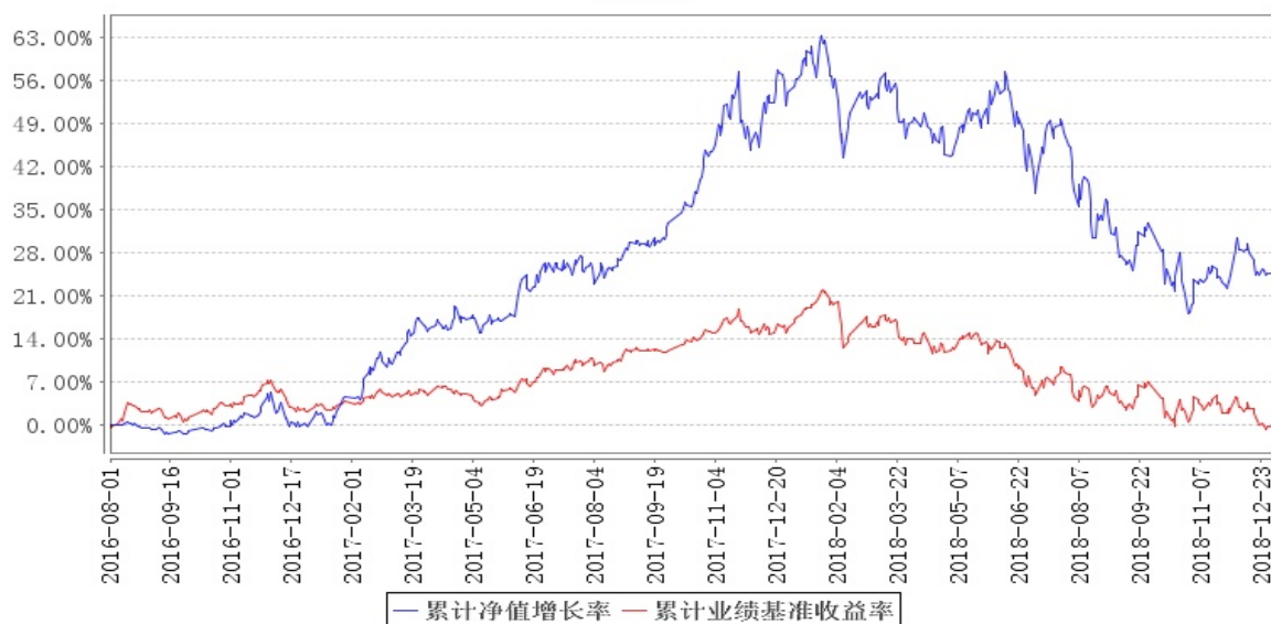
南方品质优选灵活配置混合累计净值增长率与同期业绩比较基准收益率的历史走势对比图