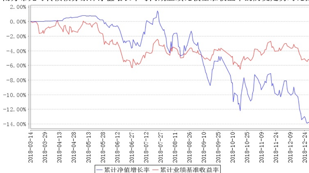
南方希元可转换债券累计净值增长率与同期业绩比较基准收益率的历史走势对比图

注：本基金合同于 2018 年 3 月 14 日生效，截至本报告期末基金成立未满一年；自基金成立日起 6 个月内为建仓期，建仓期结束时各项资产配置比例符合合同约定。