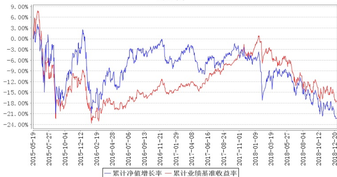
南方改革机遇灵活配置混合累计净值增长率与同期业绩比较基准收益率的历史走势对比图