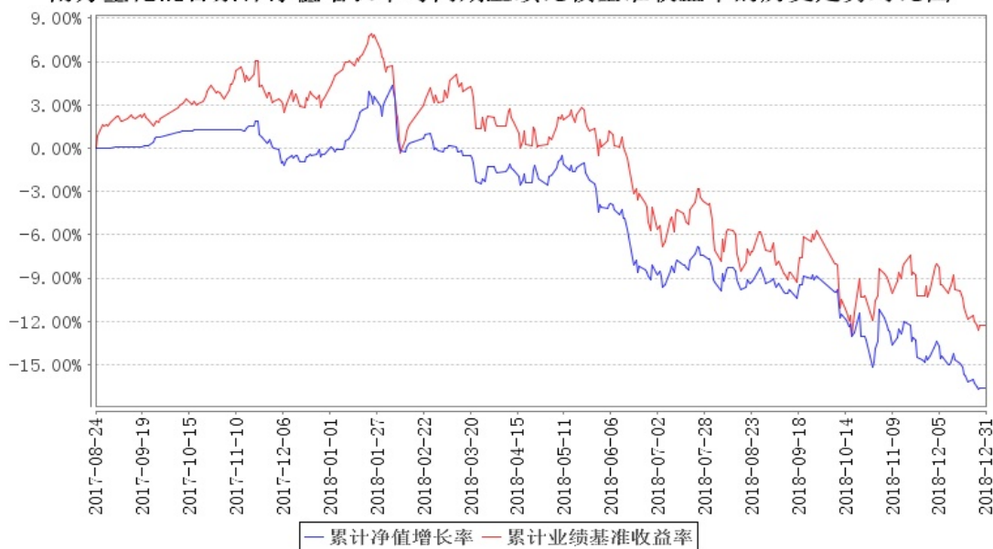
南方量化混合累计净值增长率与同期业绩比较基准收益率的历史走势对比图