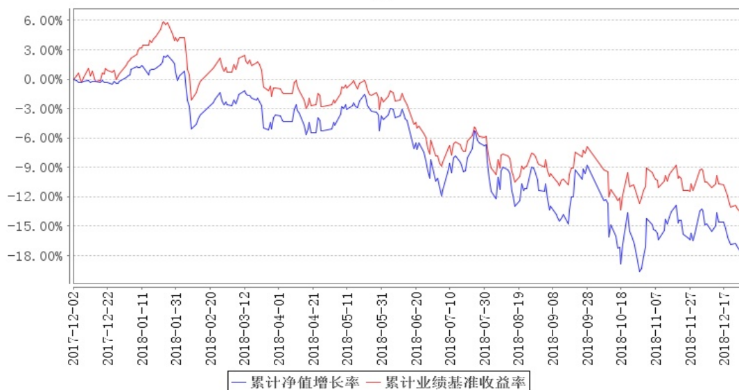
南方顺康灵活配置混合累计净值增长率与同期业绩比较基准收益率的历史走势对比图

注：本基金于 2017 年 12 月 2 日由原南方顺康保本混合型证券投资基金转型为南方顺康灵活配置混合型证券投资基金。本基金建仓期为 6 个月，建仓期结束时各项资产配置比例符合合同约定。