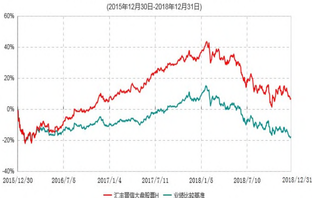
汇丰晋信大盘股票H累计净值增长率与业绩比较基准收益率历史走势对比图