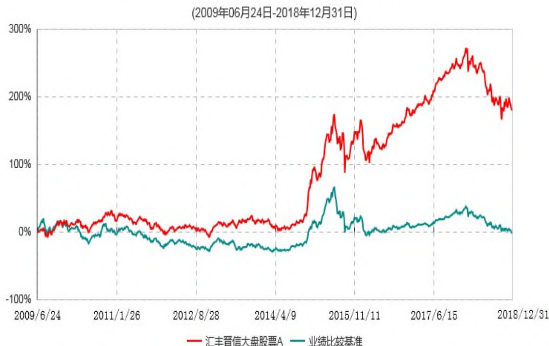
汇丰晋信大盘股票A累计净值增长率与业绩比较基准收益率历史走势对比图