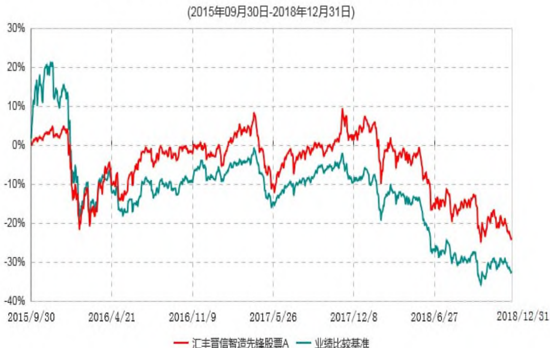
汇丰晋信智造先锋股票A累计净值增长率与业绩比较基准收益率历史走势对比图