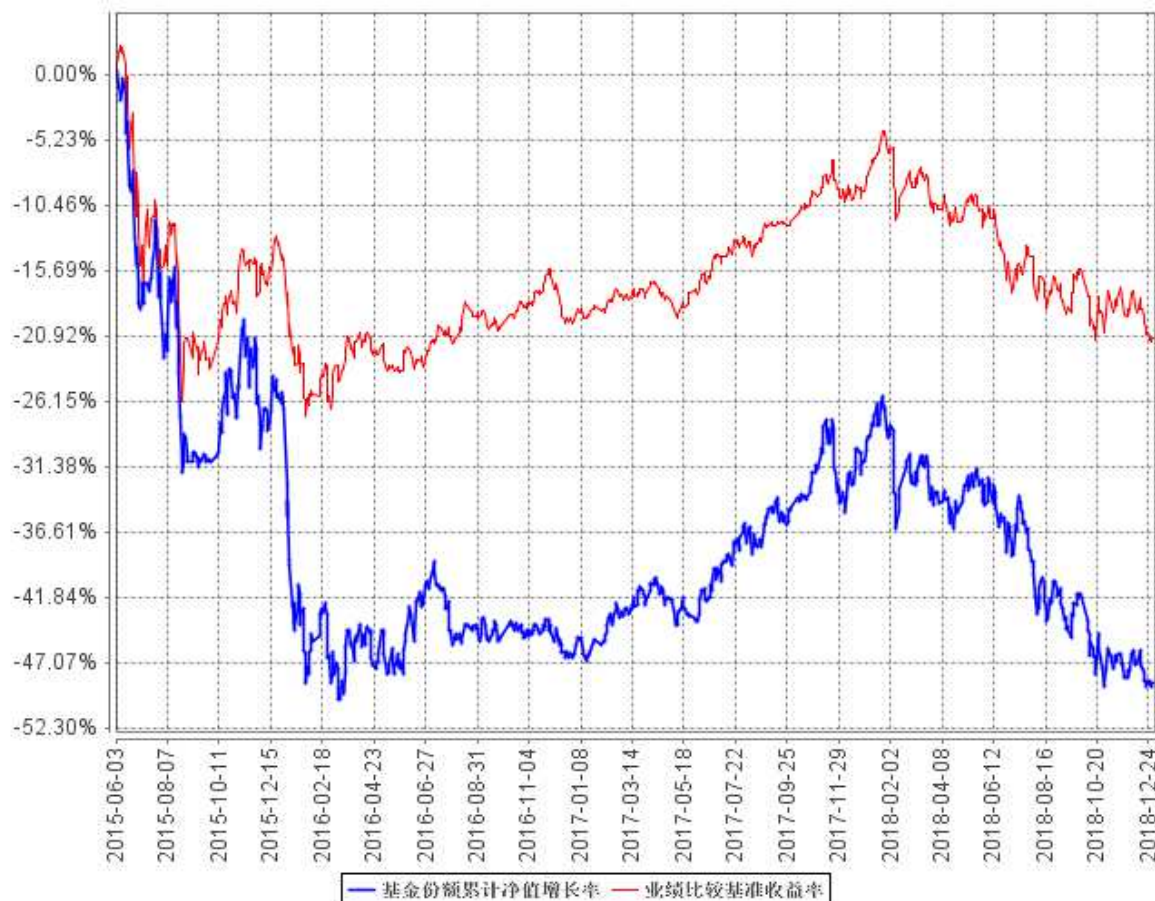
基金份额累计净值增长率与同期业绩比较基准收益率的历史走势对比图

注：本基金在建仓期结束时及截止报告期末各项投资比例已达到基金合同规定的比例要求。