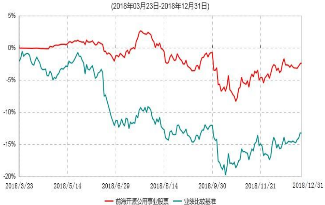
前海开源公用事业行业股票型证券投资基金累计净值增长率与业绩比较基准收益率历史走势对比图

注：①本基金的基金合于2018年3月23日生效，截至2018年12月31日止，本基金成立未 满1年。