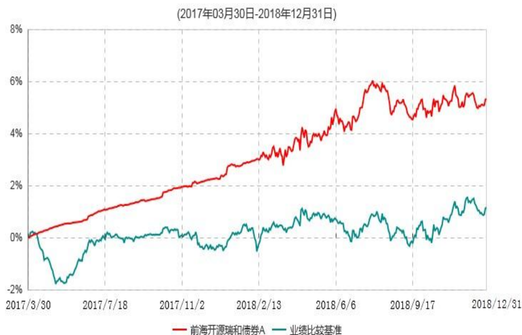
前海开源瑞和债券A累计净值增长率与业绩比较基准收益率历史走势对比图