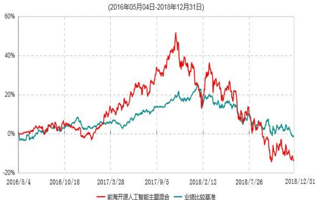
前海开源人工智能主题灵活配置混合型证券投资基金累计净值增长率与业绩比较基准收益率历史走势对比图