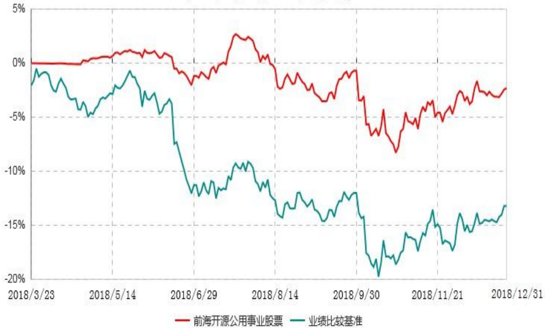
前海开源公用事业行业股票型证券投资基金累计净值增长率与业绩比较基准收益率历史走势对比图 (2018年03月23日-2018年12月31日)

注：①本基金的基金合于2018年3月23日生效，截至2018年12月31日止，本基金成立未 满1年。