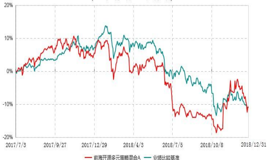
前海开源多元策略混合C累计净值增长率与业绩比较基准收益率历史走势对比图