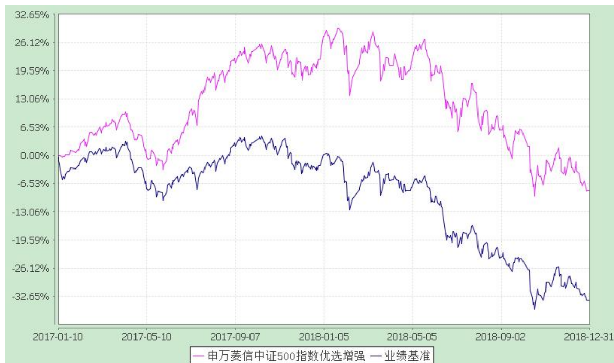
自基金合同生效以来份额累计净值增长率与业绩比较基准收益率的历史走势对比图 (2017 年 1 月 10 日至 2018 年 12 月 31 日)