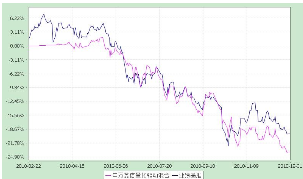
自基金合同生效以来份额累计净值增长率与业绩比较基准收益率的历史走势对比图 (2018 年 2 月 22 日至 2018 年 12 月 31 日)