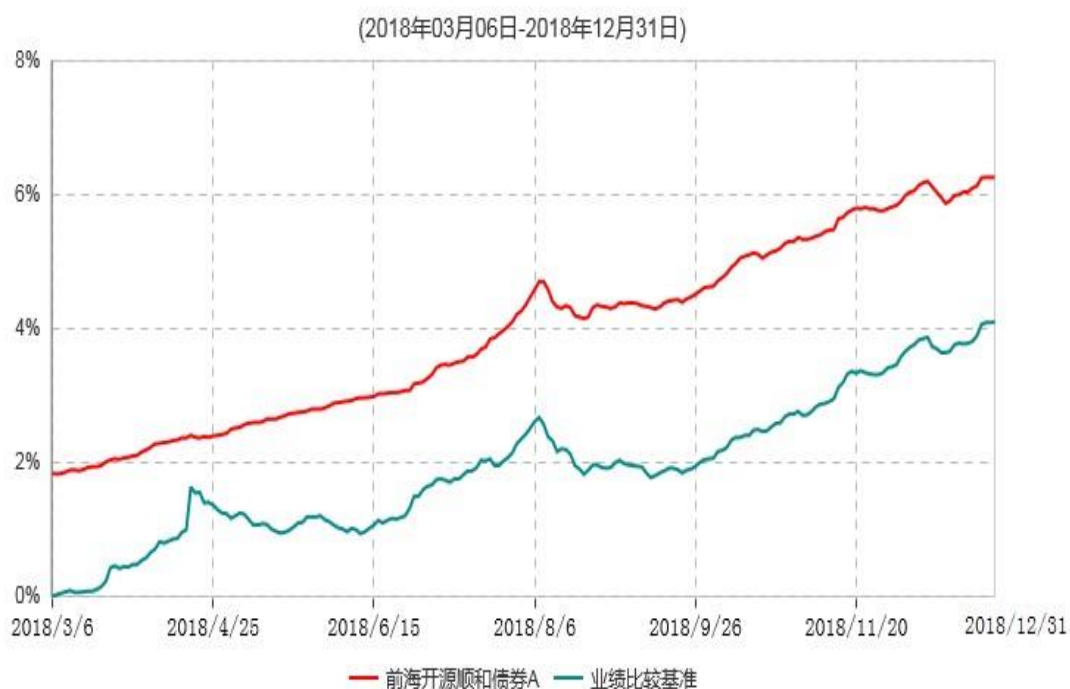
前海开源顺和债券A累计净值增长率与业绩比较基准收益率历史走势对比图