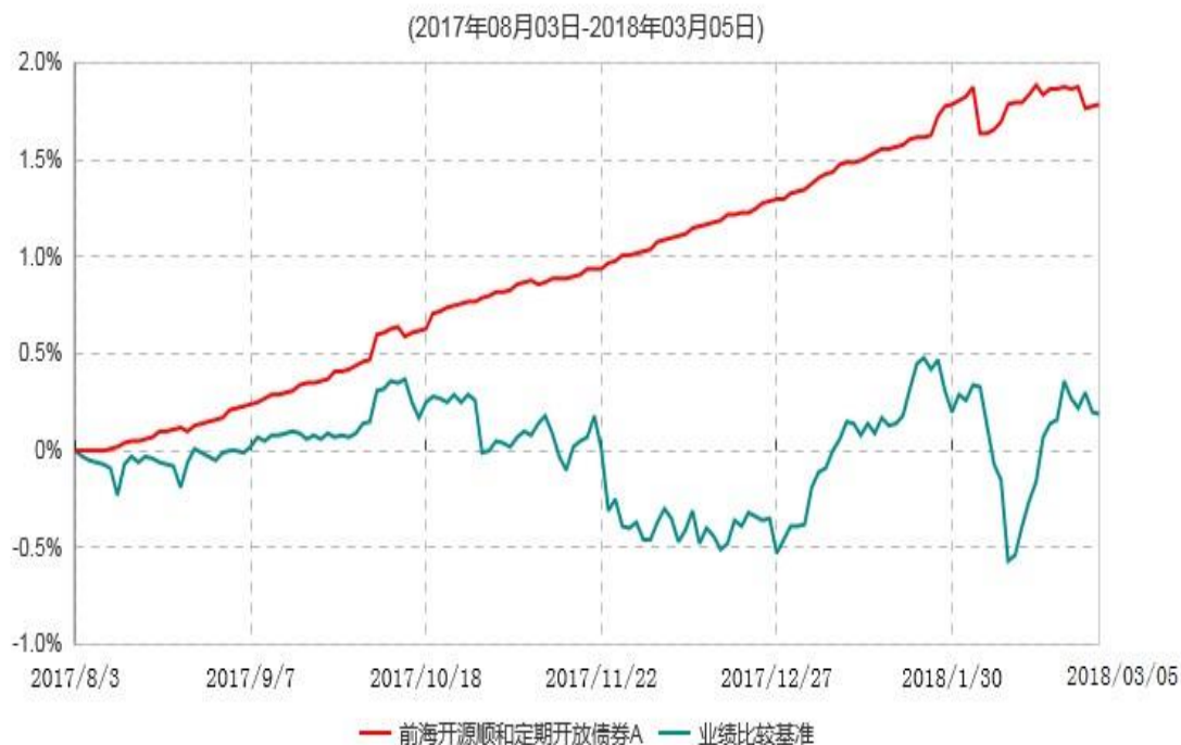
前海开源顺和定期开放债券A累计净值增长率与业绩比较基准收益率历史走势对比图