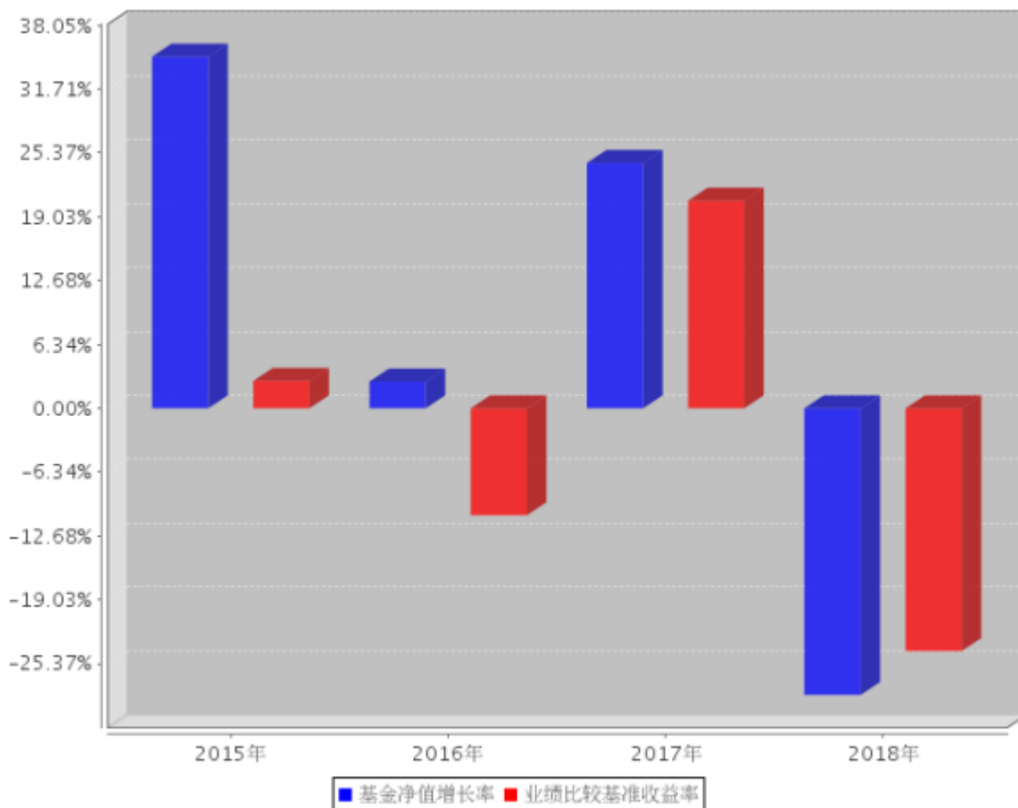
自基金合同生效以来基金每年净值增长率及其与同期业绩比较基准收益率的对比图

注：本基金生效日为2014年12月17日，2014年度的相关数据根据当年的实际存续期计算。