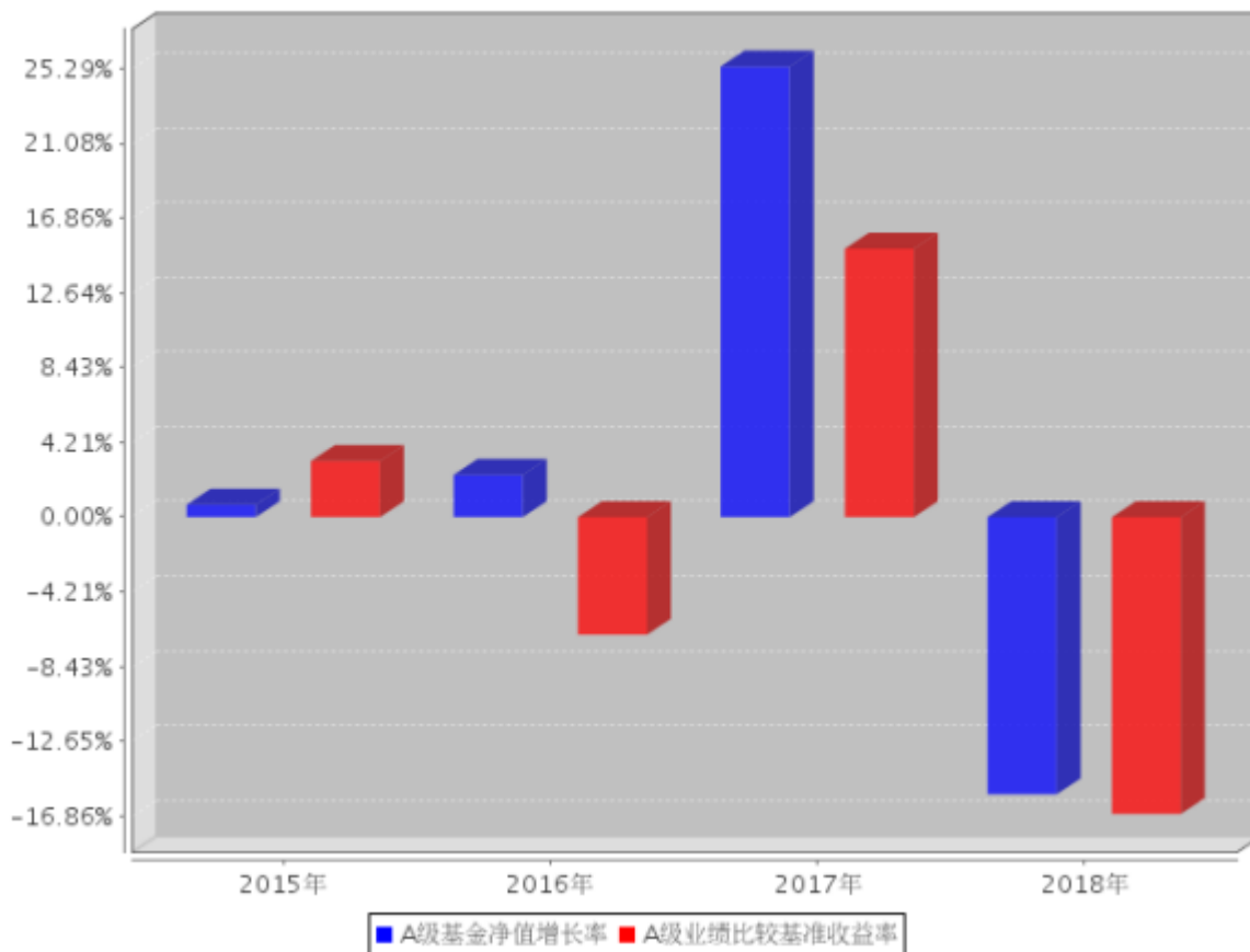
A级自基金合同生效以来基金每年净值增长率及其与同期业绩比较基准收益率的对比图