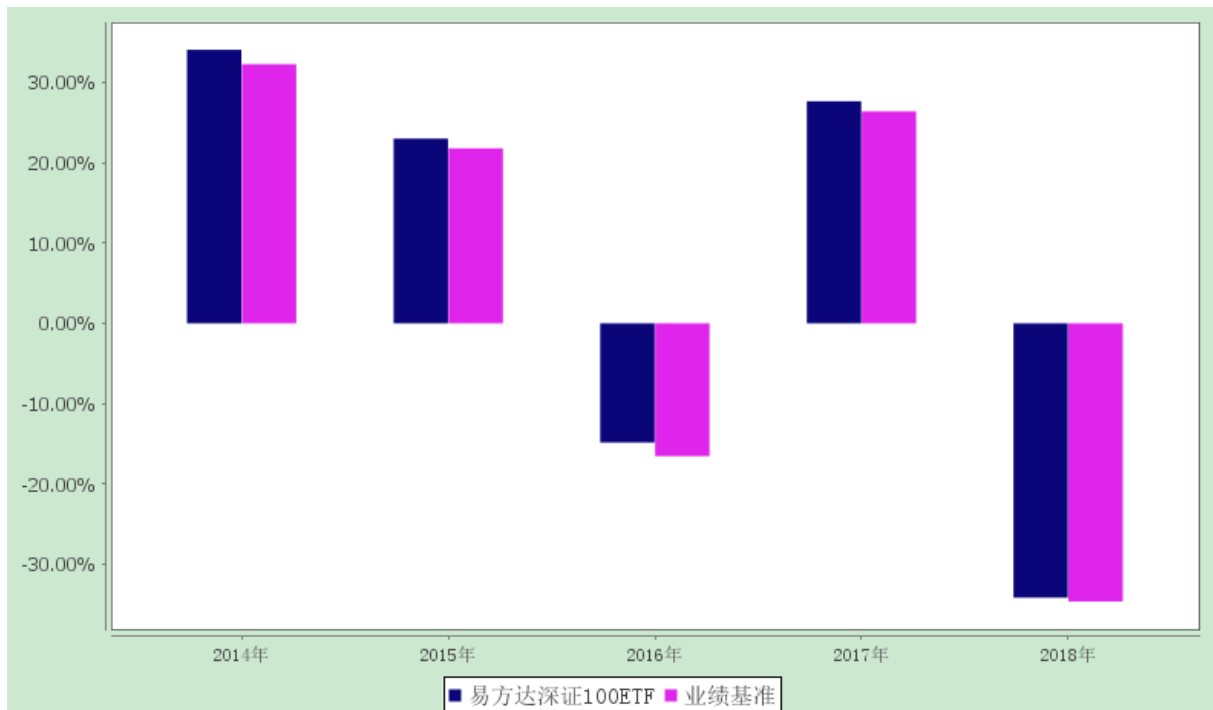
过去五年基金净值增长率与业绩比较基准历年收益率对比图