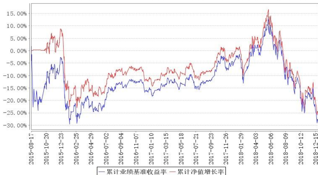
鹏华中证医药卫生累计净值增长率与同期业绩比较基准收益率的历史走势对比图