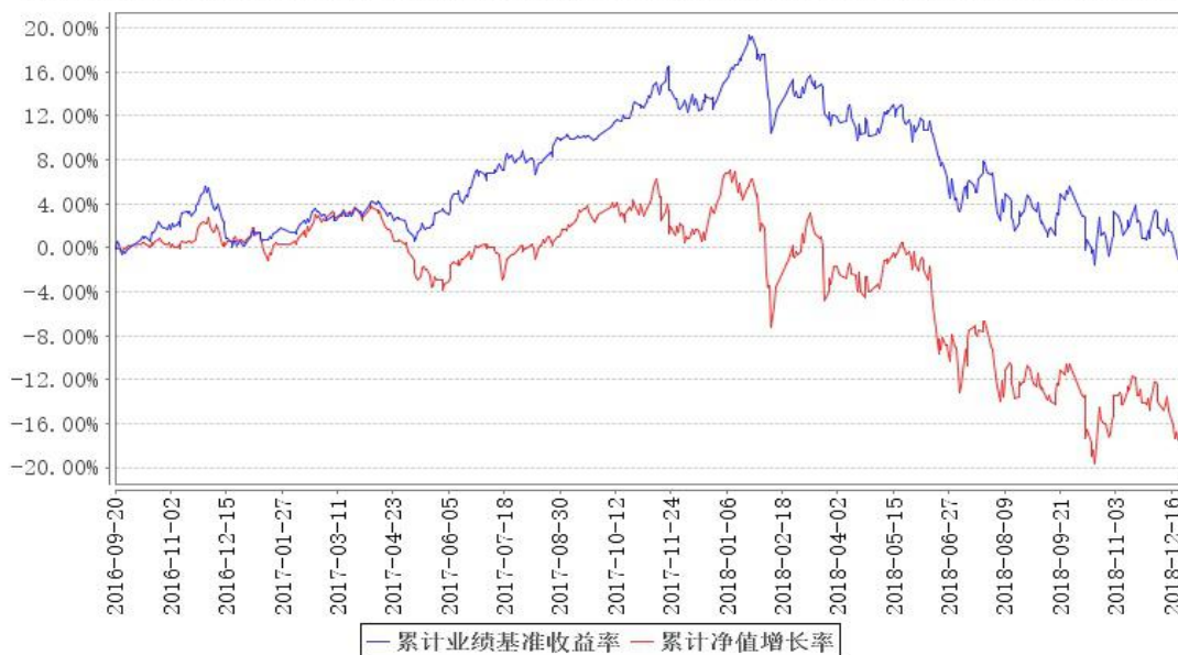
鹏华增瑞（LOF）累计净值增长率与同期业绩比较基准收益率的历史走势对比图