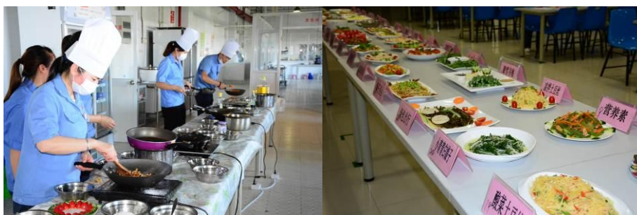
图为健康低碳餐厨艺比赛精彩瞬间

健康是我们人类永恒的话题，在 21 世纪的今天，健康更是人们关心的热点话题。因为健康的成本越来越高，疾病的负担越来越重，而健康又是我们生活中最重要的元素，如果没有了健康，何谈幸福安康。