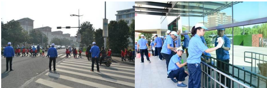
图为公司志愿者进行护学岗及园企共建活动

公司倡导人人都是志愿者，积极培养公司志愿工作者以及幸福志工推广，让家人们真正明白志愿者的意义与使命。公司志工是幸福企业八大模块的实践团队，幸福志工的职责是义务协助更多的企业、社区、学校等进行幸福典范创建，引导更多行业懂得以员工的幸福为第一要务，同时知道如何去落实。苏州固得期盼引领更多的企业、社区、医院、学校等更多的团体都开始真正落实幸福的理念并承担社会责任，让我们的社会更加和谐幸福。