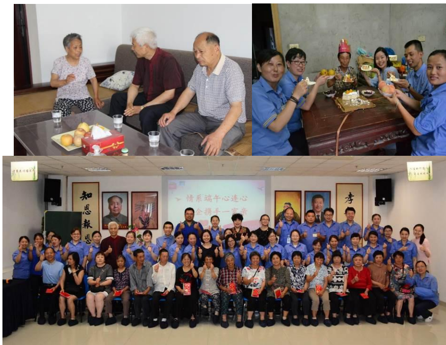
图为公司志愿者进行护学岗及园企共建活动

付出无所求，还要真感恩，幸福自然来。让我们启动内心的爱，把爱传出去，让世界因为有我而变得更美丽。