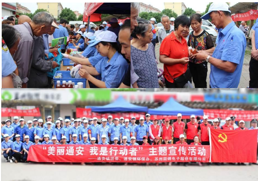
图为走进社区进行废旧电池回收，并进行环保宣导

推行绿色采购、绿色设计、绿色制造、绿色销售的 4G 经营理念，将生态环保落到实处。