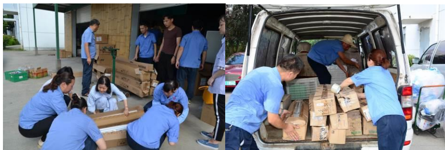
图为回收的废旧灯管送专业部门进行集中处理

废旧电池，废旧灯管的统一回收处理、资源再利用；全员低碳出行，制作、使用和推广环保酵素，节能减排，尊重自然与生命，心物一体的生态观已落地生根。