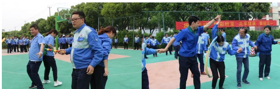
图为定期举行的趣味运动会

健康是什么？健康是我们幸福人生的基石，也是我们幸福企业八大模块建设的重要基础。“身体发肤，受之父母，不敢毁伤，孝之始也。”《孝经》里的这句话让固得家人懂得，要照顾好自己的身体，不让父母担心。持续的人文教育学习，也让全体固得家人明白“上医治未病”的道理。