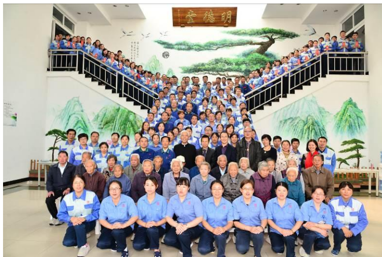
图为：公司定期举行的黄金老人、幸福宝宝幸福感恩会

我们要进行多岗位、轮转学习、交替的进行人文教育。那么学习过后我们要怎么做，我们要坚守诚信，重点落实因果的教育，让大家能够真正明理。