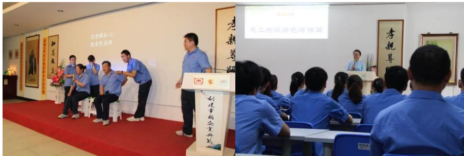
图为定期进行志工培训

爱是一种无声的承诺，只要轻轻一点火花，就能让世界充满温暖！作为固得志愿者，我们坚定的把爱心化为行动，去关爱社会上每一个需要帮助的人。