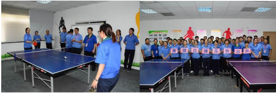
图为定期举行“乒出快乐，搏出健康”杯乒乓球友谊赛

为了进一步丰富家人们的业余生活，增强员工的体质，加强互动交流，提高团队协作精神，定期举行“乒出快乐，搏出健康”杯乒乓球友谊赛及趣味运动会等。