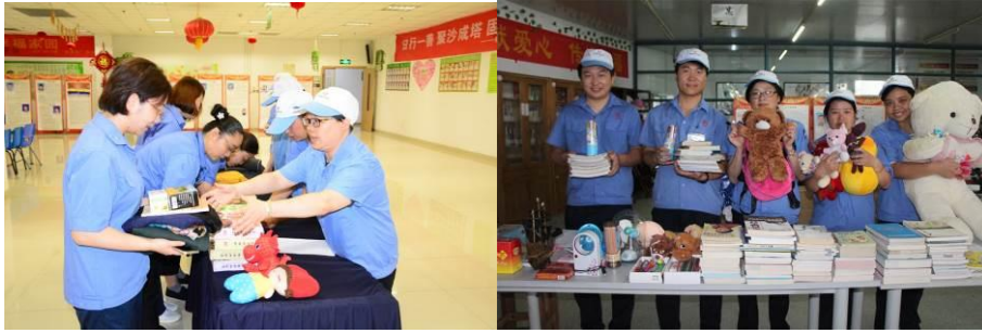
图为向贫困地区捐赠衣物图书，我们献一份爱就能带给他人一些温暖

爱是一种无声的承诺，只要轻轻一点火花，就能让世界充满温暖！作为固得志愿者，我们坚定的把爱心化为行动，去关爱社会上每一个需要帮助的人。