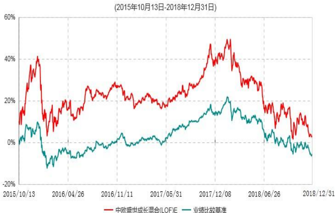
中欧盛世成长混合(LOF)E累计净值增长率与业绩比较基准收益率历史走势对比图

注：本基金于 2015 年 10 月 8 日新增 E 份额，图示日期为 2015 年 10 月 13 日至 2018 年 12 月 31 日。