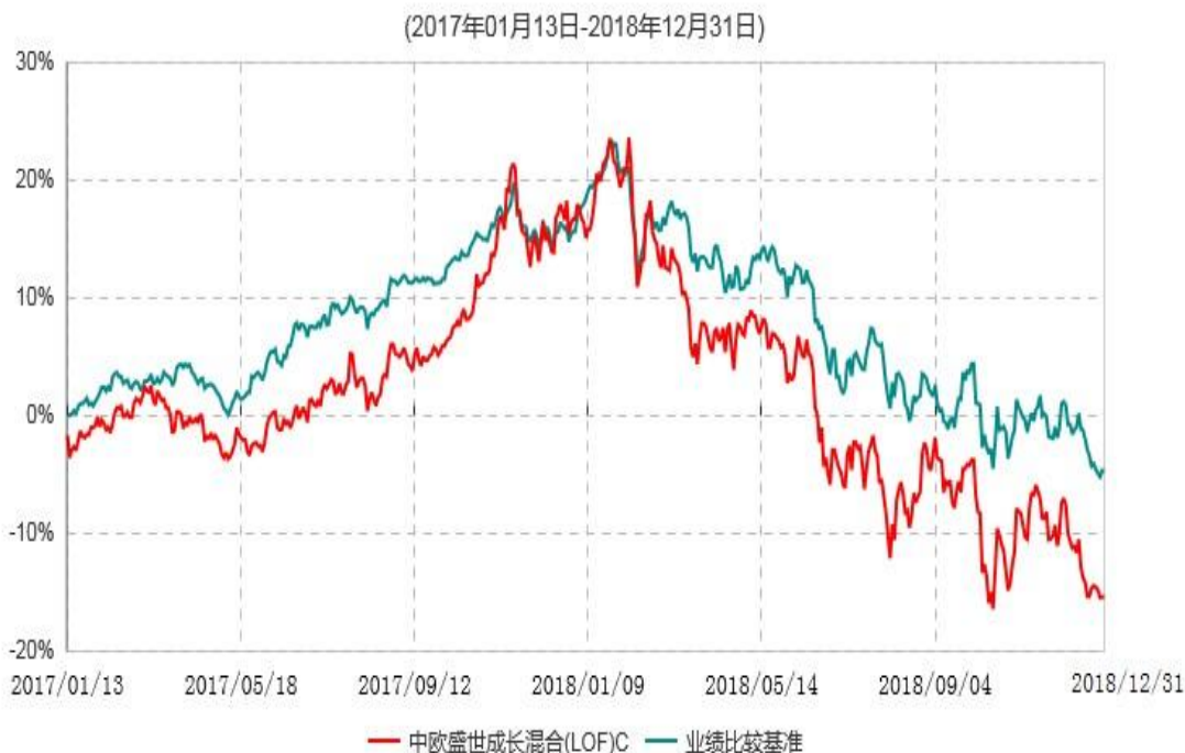
中欧盛世成长混合(LOF)C累计净值增长率与业绩比较基准收益率历史走势对比图

注：本基金于 2017 年 01 月 12 日新增 C 份额，图示日期为 2017 年 01 月 13 日至 2018 年 12 月 31 日。