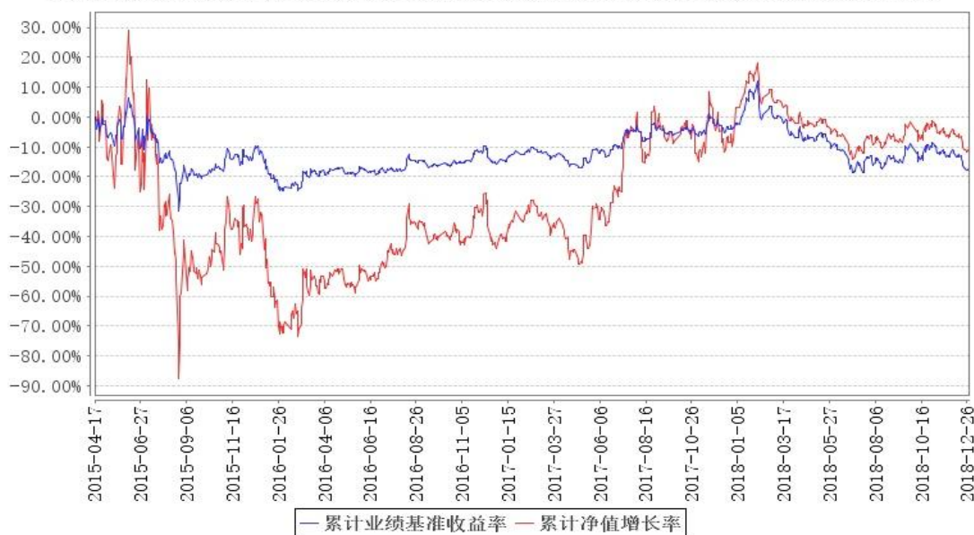
鹏华银行分级累计净值增长率与同期业绩比较基准收益率的历史走势对比图