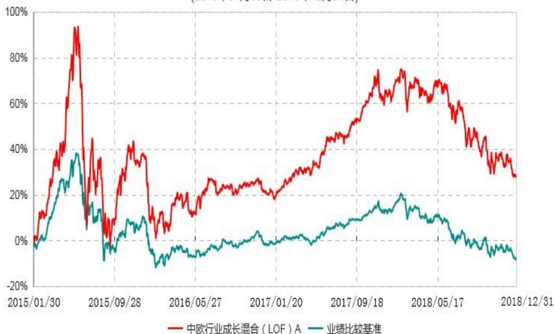
中欧行业成长混合 ( LOF ) A 累计净值增长率与业绩比较基准收益率历史走势对比图 (2015年01月30日-2018年12月31日)