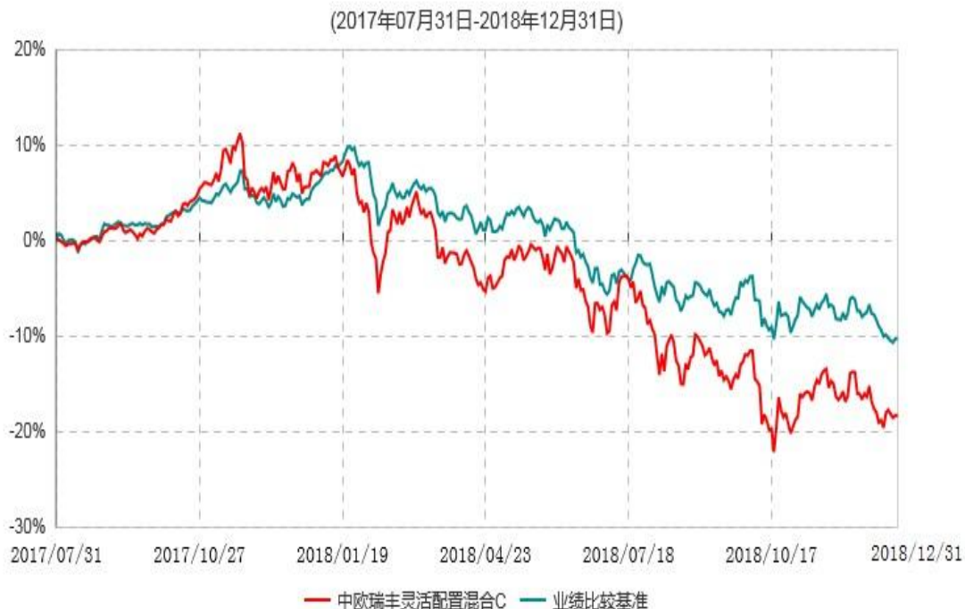
中欧瑞丰灵活配置混合C累计净值增长率与业绩比较基准收益率历史走势对比图

注：本基金合同生效日期为 2017 年 7 月 31 日，按基金合同的规定，本基金自基金合同生效起六个月为建仓期，建仓期结束时本基金的各项资产配置比例已达到基金合同约定。