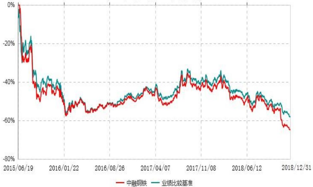
中融国证钢铁行业指数分级证券投资基金累计净值增长率与业绩比较基准收益率历史走势对比图 (2015年06月19日-2018年12月31日)

注：按照基金合同和招募说明书的约定，本基金自合同生效日起6个月内为建仓期，建仓期结束时本基金的各项资产配置比例符合基金合同的有关约定。