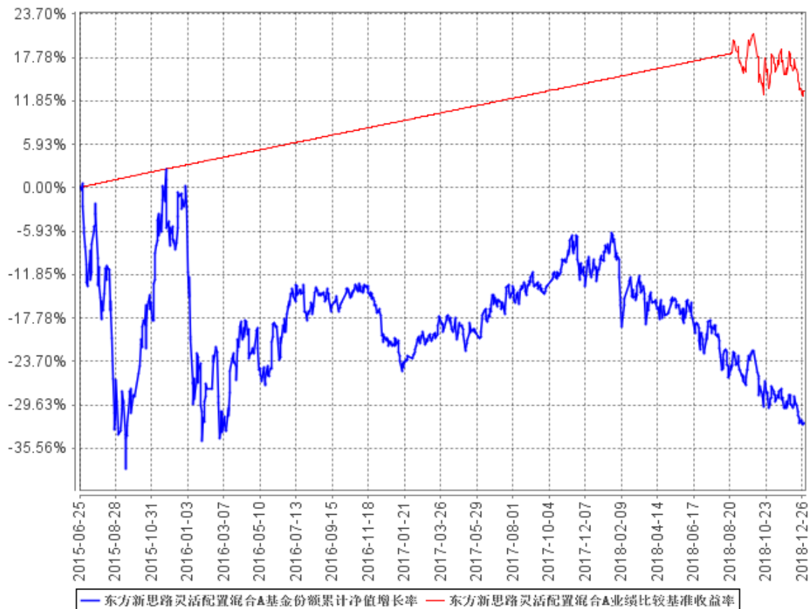
东方新思路灵活配置混合A基金份额累计净值增长率与同期业绩比较基准收益率的历史走势对比图