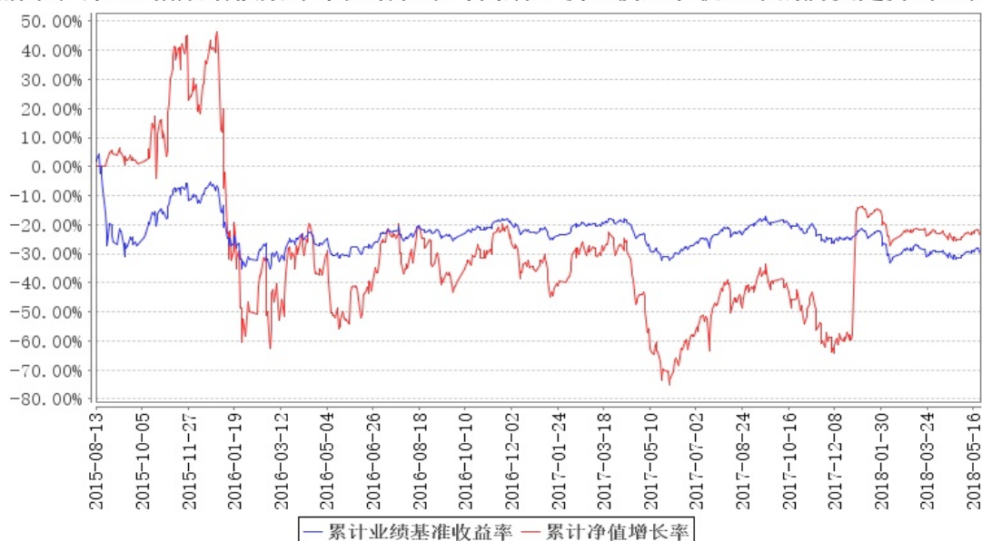
鹏华沪深300指数增强累计净值增长率与同期业绩比较基准收益率的历史走势对比图