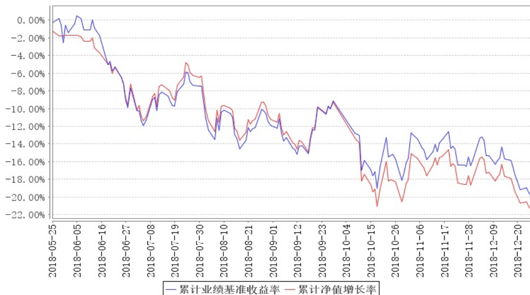
鹏华沪深300指数增强累计净值增长率与同期业绩比较基准收益率的历史走势对比图