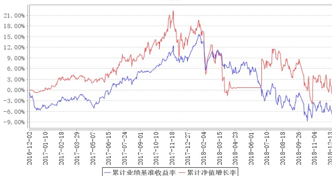
鹏华沪深港新兴成长混合累计净值增长率与同期业绩比较基准收益率的历史走势对比图