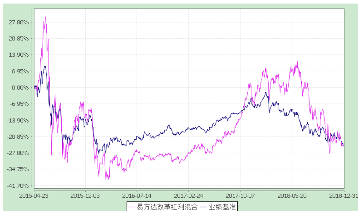
易方达改革红利混合型证券投资基金 份额累计净值增长率与业绩比较基准收益率历史走势对比图 (2015年4月23日至2018年12月31日)

注：自基金合同生效至报告期末，基金份额净值增长率为-24.80%，同期业绩比较基准收益率为-24.08%。