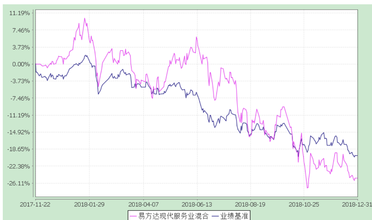
易方达现代服务业灵活配置混合型证券投资基金 份额累计净值增长率与业绩比较基准收益率历史走势对比图 (2017年11月22日至2018年12月31日)

注：1.按基金合同和招募说明书的约定,本基金的建仓期为六个月,建仓期结束时投资于现代服务业相关资产占非现金资产的比例不达标,本基金已在法规规定的期限内调整完毕。建仓期结束时其他各项资产配置比例符合本基金合同(第十二部分二、投资范围,三、投资策略和四、投资限制)的有关约定。