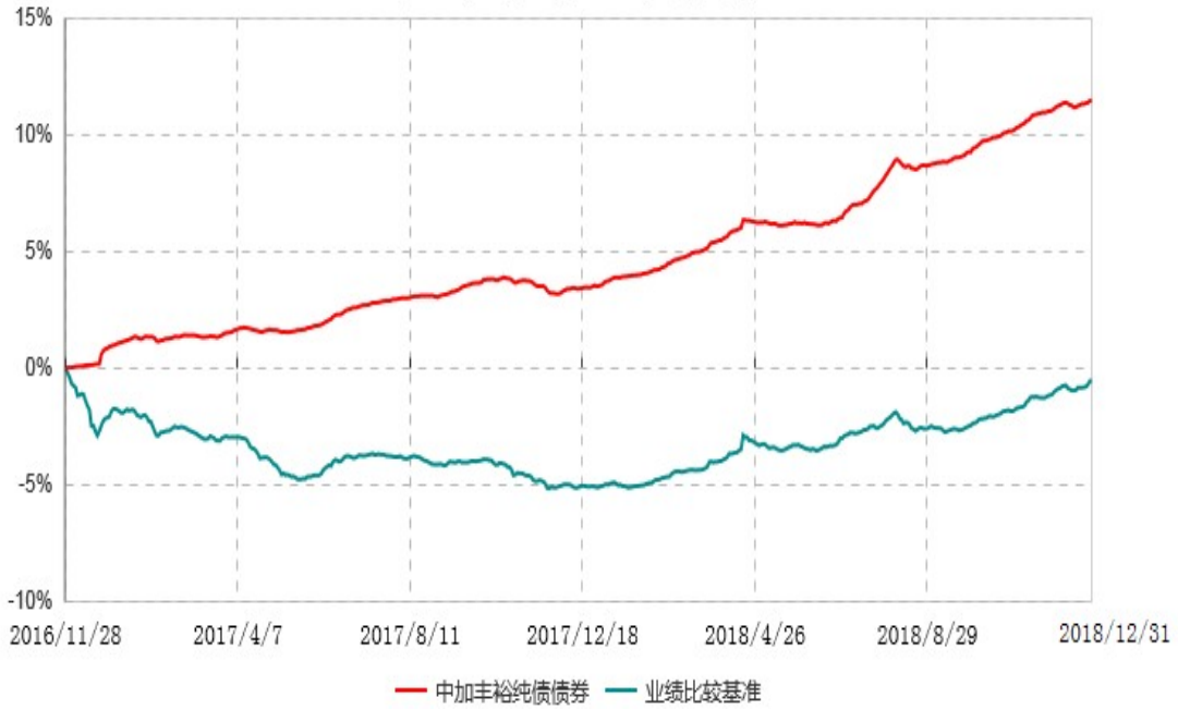
中加丰裕纯债债券型证券投资基金累计净值增长率与业绩比较基准收益率历史走势对比图 (2016年11月28日-2018年12月31日)