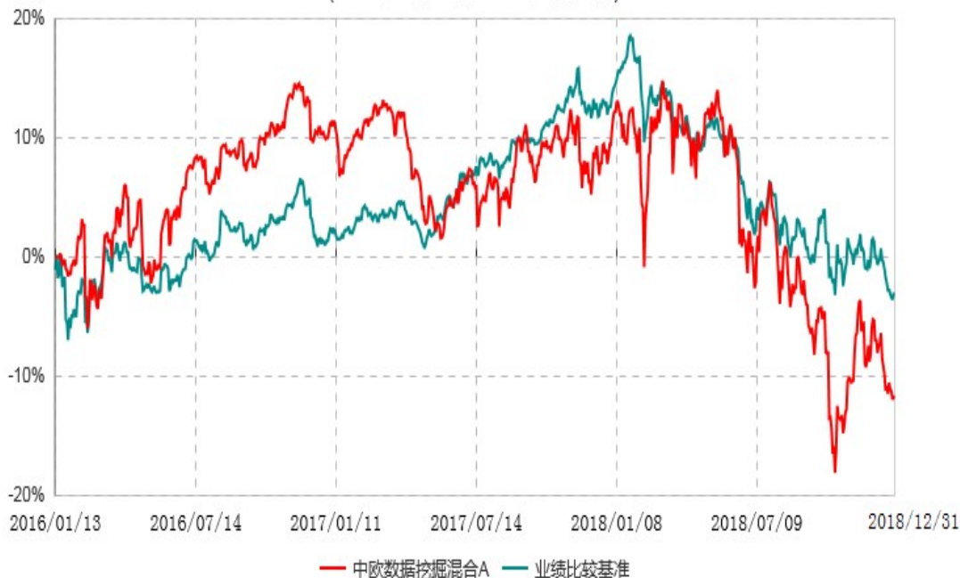
中欧数据挖掘混合C累计净值增长率与业绩比较基准收益率历史走势对比图