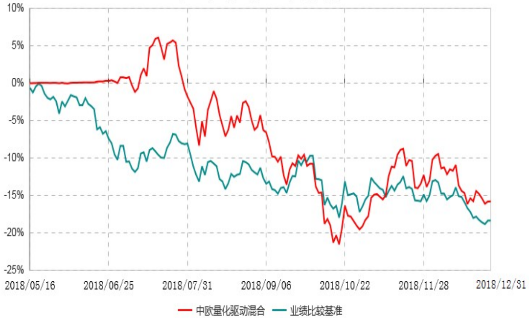
中欧量化驱动混合型证券投资基金累计净值增长率与业绩比较基准收益率历史走势对比图 (2018年05月16日-2018年12月31日)

注：本基金基金合同生效日期为2018年5月16日，自基金合同生效日起到本报告期末不满一年，按基金合同的规定，本基金自基金合同生效起六个月为建仓期，建仓期结束时各项资产配置比例已符合基金合同约定。