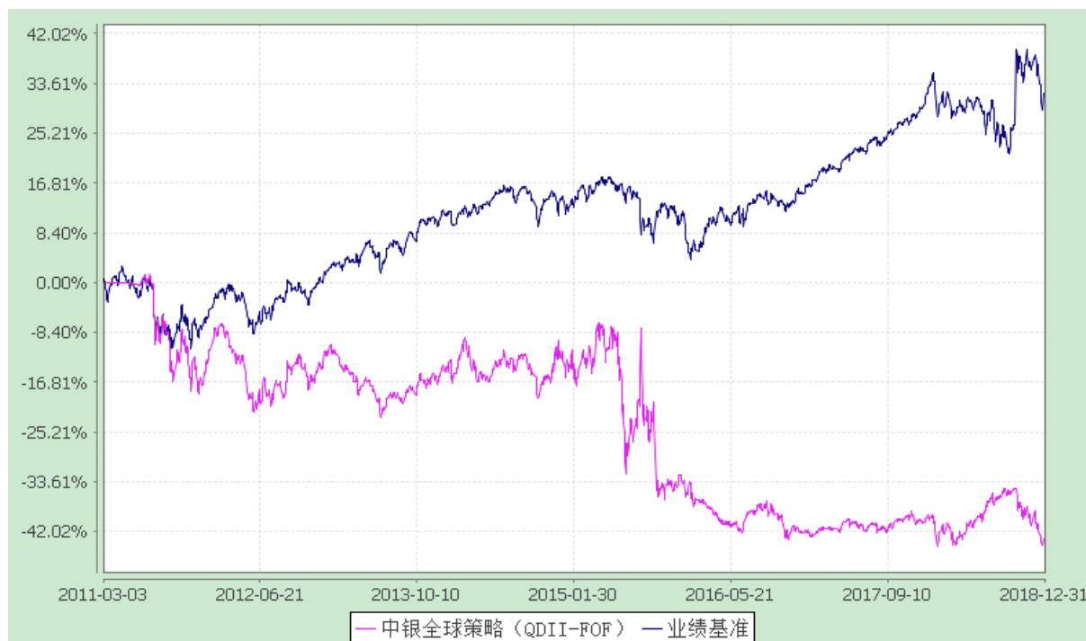
中银全球策略证券投资基金（FOF） 份额累计净值增长率与业绩比较基准收益率历史走势对比图 (2011年3月3日至2018年12月31日)

注：按基金合同规定，本基金自基金合同生效起 6 个月内为建仓期，截至建仓结束时各项资产配置比例均符合基金合同约定。